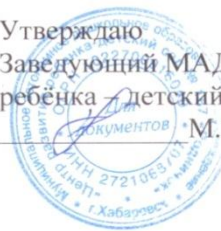
ГРАФИК РАБОТЫ МЕТОДИЧЕСКОГО КАБИНЕТА